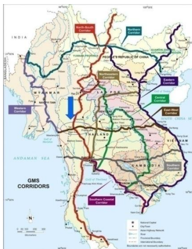
รูปที่ ๒ ภาพแสดงโครงข่ายการคมนาคมทางบก ตามแนวพื้นที่เศรษฐกิจ Economic Corridor

จากลักษณะภูมิศาสตร์ที่เป็นพื้นที่ชายแดน และเป็นพื้นที่ที่มีศักยภาพพอสมควรในเรื่องของระบบโครงสร้างพื้นฐาน สาธารณูปโภค รวมถึงความเข้มแข็งทางด้านเศรษฐกิจการค้าและการลงทุนตั้งนั้น ลักษณะของเขตเศรษฐกิจพิเศษที่ต้องการดำเนินการ คือ เขตเศรษฐกิจพิเศษชายแดน (Special Border Economic Zone) ซึ่งเป็นเขตเศรษฐกิจพิเศษรูปแบบหนึ่งที่มีเขตพื้นที่ติดชายแดน โดยส่วนใหญ่กำหนดไว้สำหรับการประกอบอุตสาหกรรมเกษตรแปรรูป หรืออุตสาหกรรมส่งเสริม และกิจกรรมอื่นที่เกี่ยวข้องกับการประกอบอุตสาหกรรมเกษตรแปรรูปหรืออุตสาหกรรมส่งเสริม ภายในเขตดังกล่าวประกอบด้วยศูนย์บริการด้านศุลกากรแบบ One Stop Service เพื่ออำนวยความสะดวกให้การส่งออกและนำเข้าสินค้าชายแดน คลังสินค้า และอาคารพาณิชย์ และส่งเสริมสิทธิประโยชน์ที่ไม่ใช่ภาษีเช่นเดียวกับ นิคมอุตสาหกรรมทั่วไป (General Industrial Estate) การยกเว้นภาษีนำเข้า การยกเว้นภาษีเงินได้ การตั้งคลังสินค้าทัณฑ์บนและศูนย์กระจายสินค้าด้าน Logistics เป็นต้น